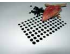
PIGEON DE LICQUES BLEU SUREAU